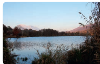
LES RIVES PAISIBLES DU LAC DE SAINTE-HÉLÈNE