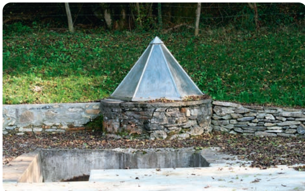
SOURCE DE LA SAUSSAZ

Après le hameau de Longemale en arrivant sur la D 204, tourner à droite. À gauche, pendre le chemin au niveau des Écuries de Coise et découvrir la source de la Saussaz. Revenir sur vos pas et continuer la D 204.