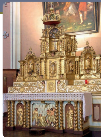
L'AUTEL DE L'ÉGLISE DE CHÂTEAUNEUF

Sur les cartes anciennes, on trouve le nom de Maltaverne et non celui de Châteauneuf. Cette particularité a été favorisée par l'éloignement entre l'église et la Route Royale, axe principal de circulation. L'appellation Châteauneuf était limitée au village de l'Église.