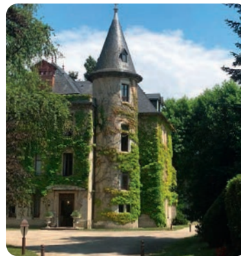
CHÂTEAU DE LA TOUR DU PUIS

Prendre la D 31, face à l'église, qui serpente entre les plantations arboricoles en direction du hameau Le Puits, la traverser et continuer tout droit sur la D 31a. Au cœur du hameau se trouve le château de la Tour du Puits. Arriver au hameau Les Plans poursuivre jusqu'à un carrefour et prendre la route à gauche (descendre avec prudence).